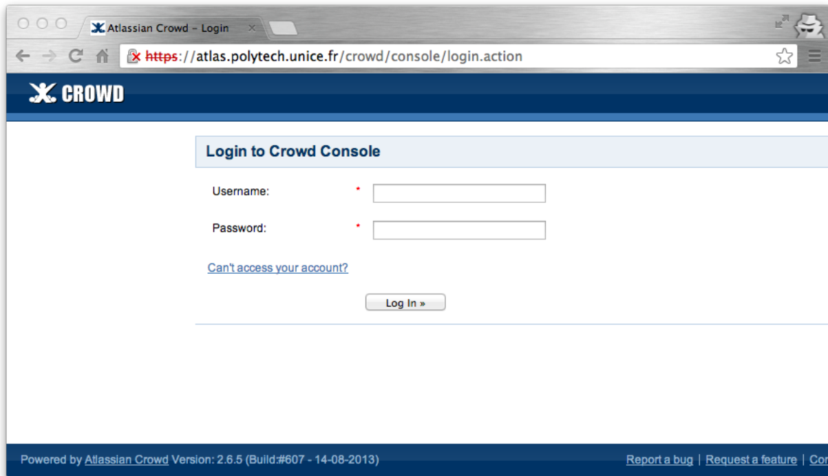
Fig 1. Écran de connexion au système Crowd.