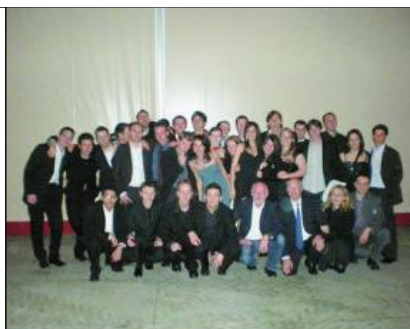
Que ce soit pour célébrer le 40 e anniversaire des MIAGE (à gauche) ou pour leur soirée de gala (à droite), étudiants et enseignants répondent toujours à l'appel.

« Méthodes informatiques appliquées à la gestion des entreprises », voilà ce que signifie l'acronyme MIAGE. Il s'agit d'une formation universitaire nationale, présente dans une vingtaine d'établissements supérieurs en France et qui s'est internationalisée, notamment au Maroc. À Nice, cette formation fait partie intégrante de l'UNS à travers un institut universitaire professionnalisé qui offre six promotions se distinguant par leur pluridisciplinarité.